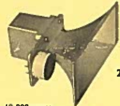
KELLY Tweeter à ruban