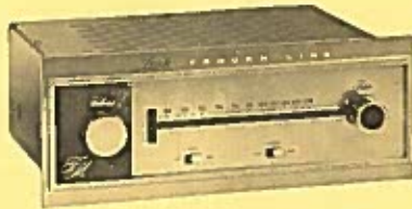
LEAK TUNER FM