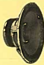
WHARFEDALE 8 RS/DD21 cm