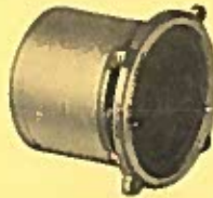
WHARFEDALE 3 HF UNIT