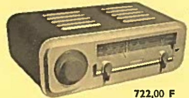
QUAD TUNER AM