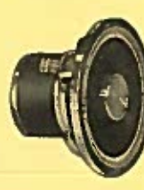
VEGA MEDOMEX 15