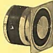
VEGA 90 TM LB TWEETER