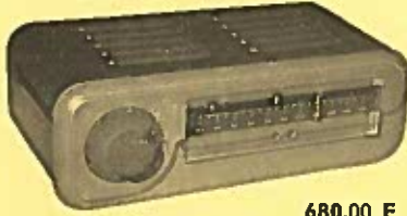
QUAD TUNER FM