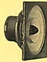
LOWTHER P.M. 6